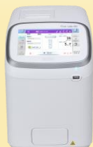
The Lab 001