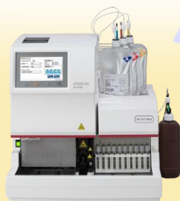
グリコヘモグロビン分析装置 ADAMS A1c HA-8190V