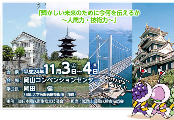
ぽけえ盛り上げるんジャー