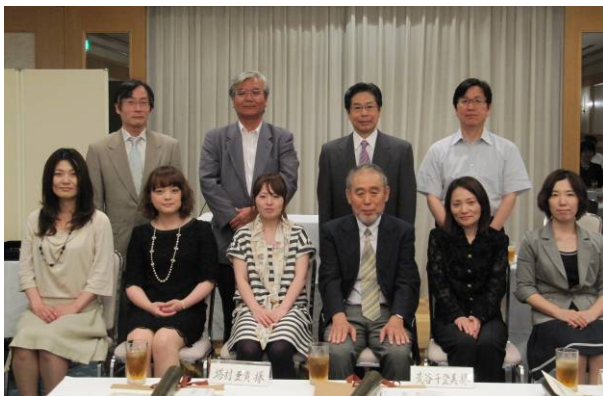
学術業績者賞、学術奨励賞、特別表彰の皆様