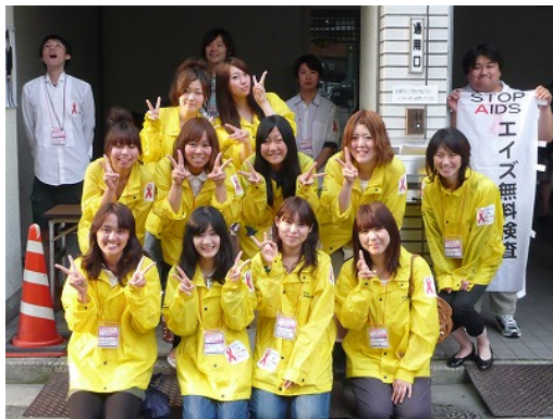
山陽女子短期大学スタッフのみなさま