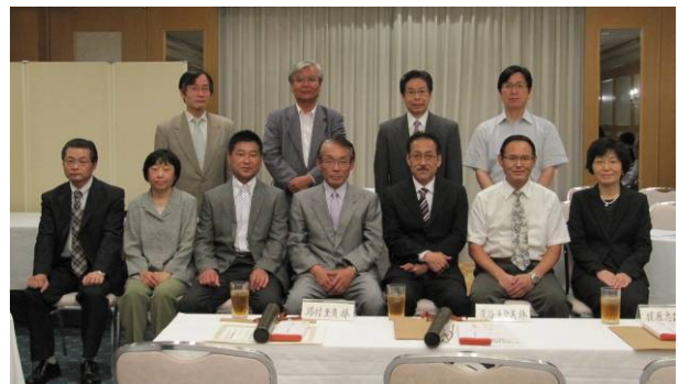
永年職務精励者表彰の皆様