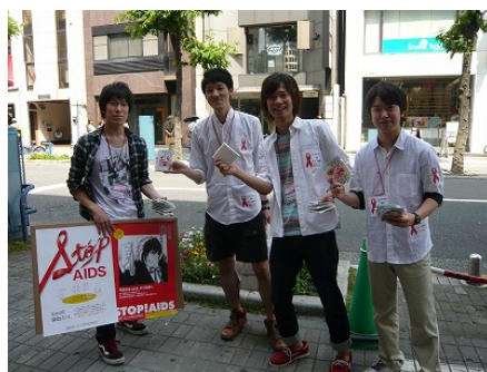
ボランティアスタッフによる予防啓発品の配布のもよう