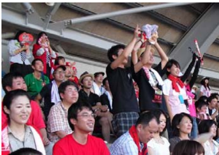
思わず立ちあがっての応援！！

初めてのマツダスタジアムは、球場に向かう広島駅から始まっていました。大学で県外に出ていた私は、カープ観戦がある日の広島駅の変化を、話では聞いていましたが、始めて自分の目で見ました。私は、その活気と人の多さに少々戸惑いを感じながらも、試合前のワクワクを感じ、そして滝のような汗をかきながらマツダスタジアムまで向かいました。スタジアムではお店の多さ、そして何より値段の高さが気になりました。この値段の高さ