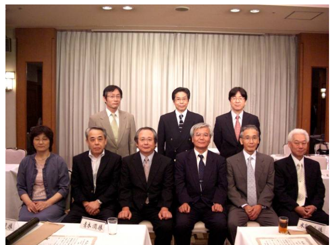
功労者賞、永年職務精励者賞の皆様