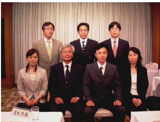
学術業績者賞、学術奨励賞の皆様