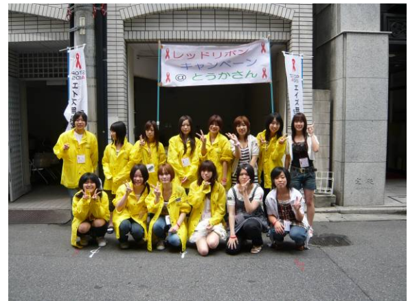
山陽女子短期大学 ボランティアのみなさま