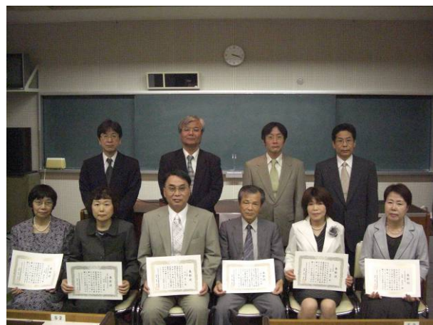
功労者賞、特別表彰、永年職務精励者賞の皆様