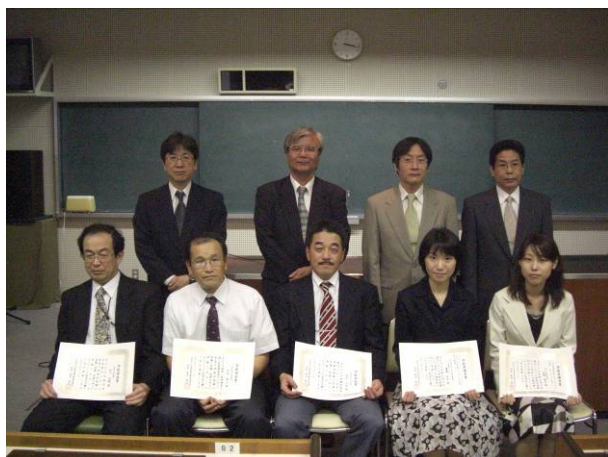
学術業績者賞、学術奨励賞の皆様